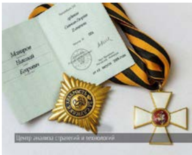
Орден с наградной книжкой

Первым георгиевским кавалером в Российской Федерации стал генерал-полковник Сергей Макаров. На-