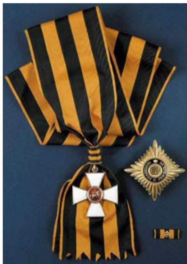
Внешний вид Ордена Святого Георгия I степени

четырёх степеней, среди которых великие русские полководцы: М.И. Кутузов и М.Б. Барклай-де-Толли.